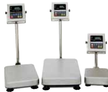
Modèle: Série HV-WP / HW-WP Echelle triple / Echelle haute résolution HV-WP: 3kg / 1g – 220kg / 100g HW-WP: 10kg / 1g – 220kg / 20g