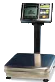
Modèle: Série FS Facile à lire & vérification rapide 6kg / 2g – 30kg / 10g