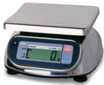
Modèle: Série SK-WP Balance compacte 1000g / 0.5g – 20kg / 0.01kg

Nos balances au standard IP 65, en acier inoxydable sont durables, polyvalentes et fiables.