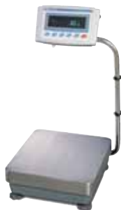
Modèle: Série GP-WP Mesure précise & réponse rapide 12kg / 0.1g – 101kg / 1g